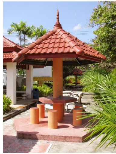
ภาพศาสนานั่งพักผ่อน