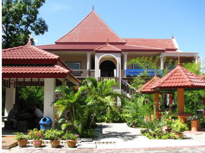
ภาพแผนกวิชาเทคโนโลยีสารสนเทศ