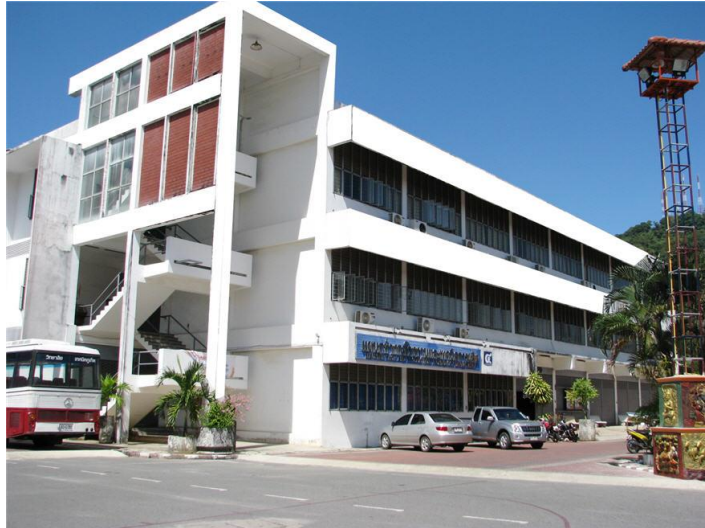
ภาพแผนกวิชาช่างกลโรงงาน