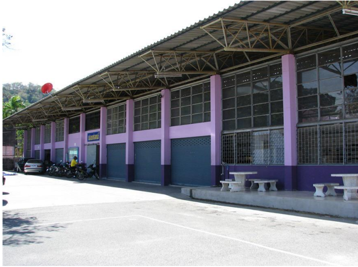
ภาพแผนกวิชาช่างยนต์