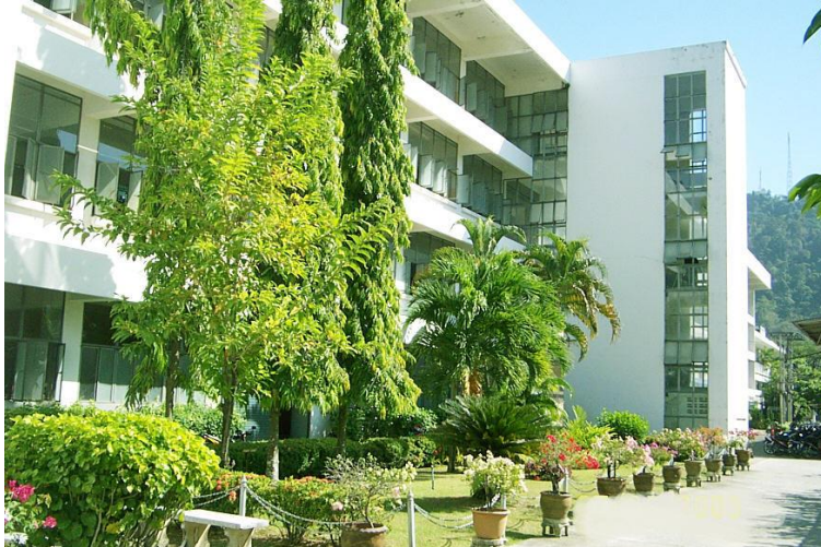
ภาพอาคาร 2 แผนกเทคนิควิศวกรรมหมื่อแร่และสิ่งแวดล้อม และแผนกเทคนิคพื้นฐาน