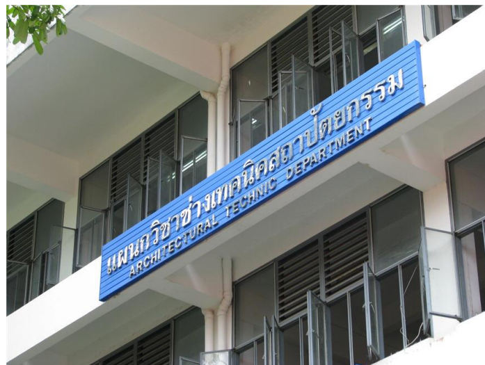
ภาพแผนกวิชาช่างเทคนิคสถาปัตยกรรม