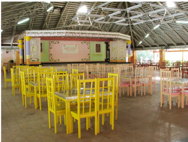
ภาพภายในโรงอาหาร