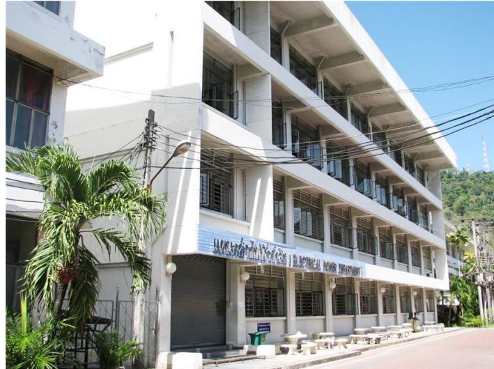
ภาพแผนกวิชาช่างไฟฟ้า