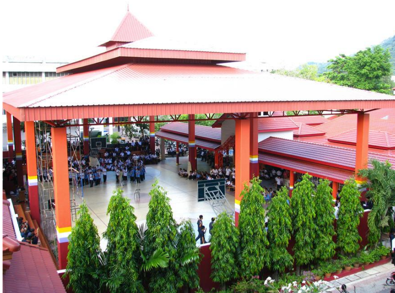
ภาพอยู่สัมนารักษะยม