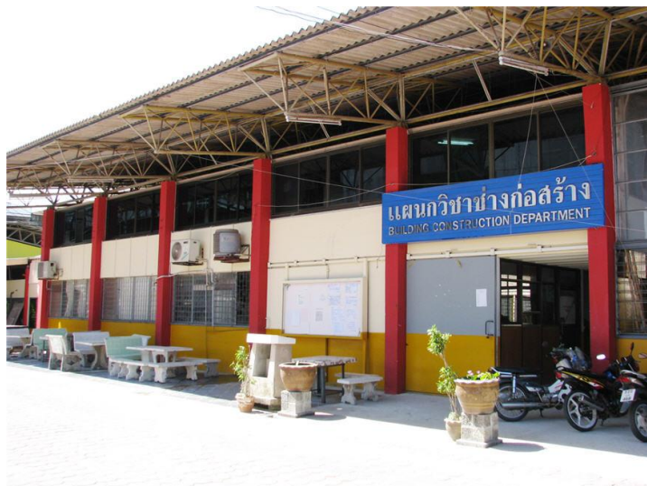
ภาพแผนกวิชาช่างก่อสร้าง