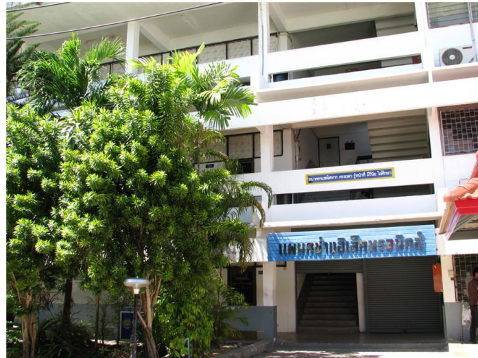
ภาพแผนกวิชาช่างอิเล็กทรอนิกส์