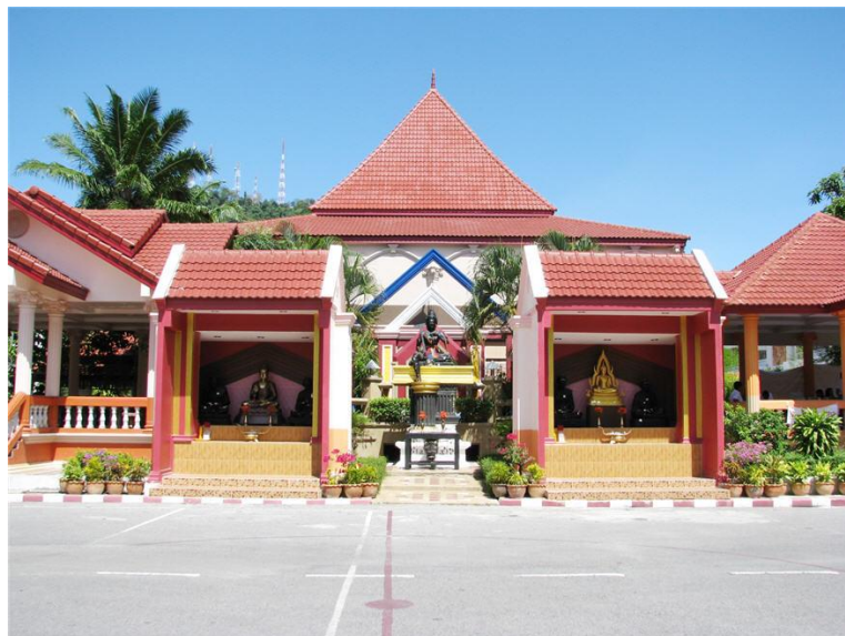
ภาพบริเวณลานหลวงปู่และพระวิษณุกรรม