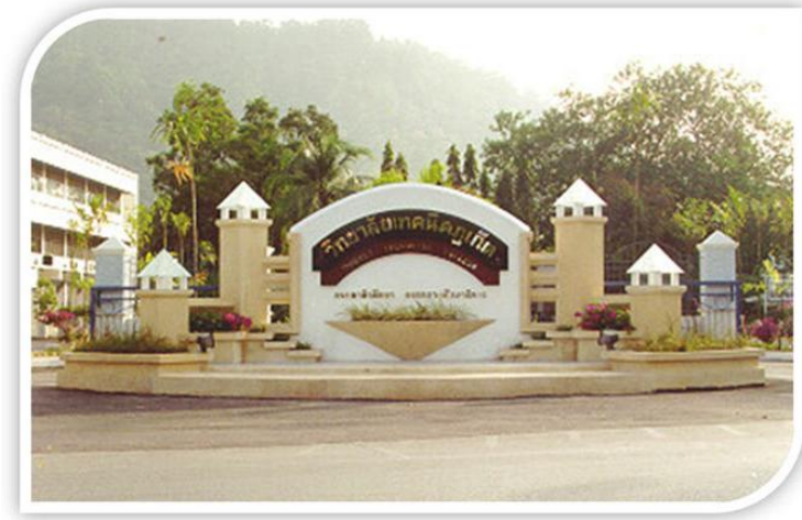
ภาพป้ายวิทยาลัยเทคนิคภูเก็ต